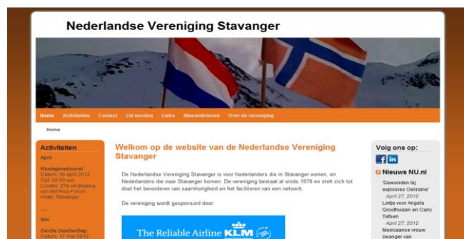
De nieuwe website